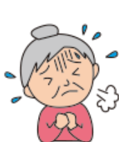
食後に声がかすれる・痰がからむ