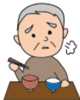
食事に時間がかかる