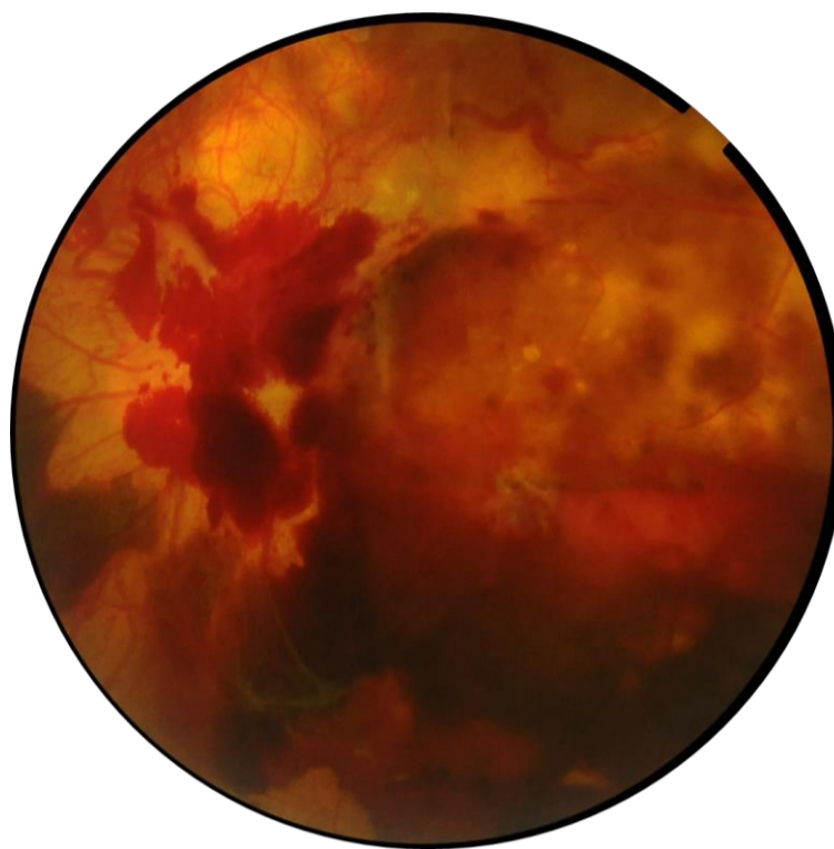
重症化した網膜症の眼底