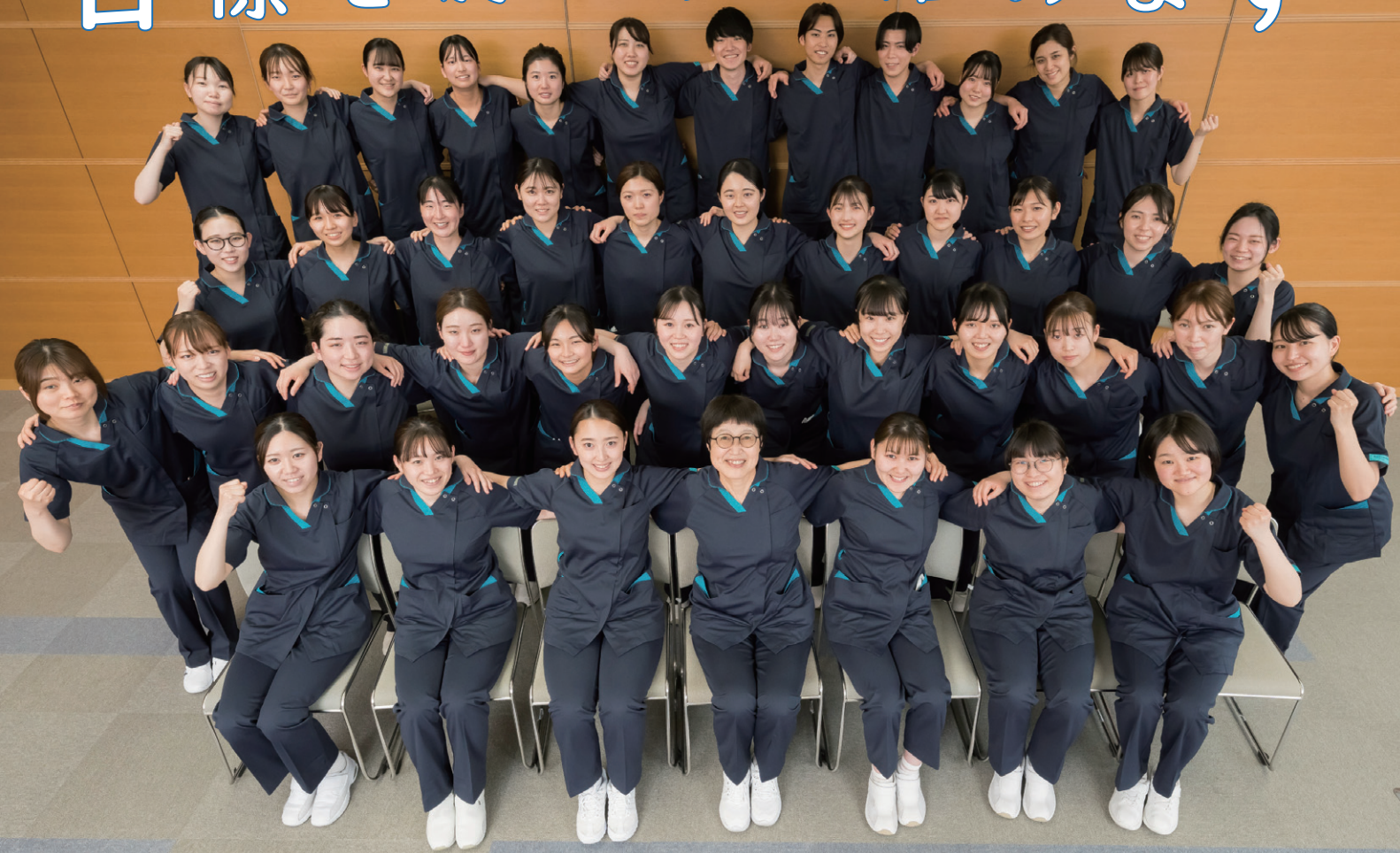
看護局長と41人の新しい仲間たち